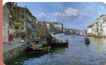
B. Bezzi, Canal Grande a Venezia , 1893, coll. privata

A Castel Caldes fino al 5 novembre è visitabile la mostra monografica, curata da Roberto Pancheri in collaborazione con Margherita de Pilati, dedicata a Bezzi "pittore di figura", nella quale viene analizzato e approfondito l'approccio dell'artista alla figura umana, sia nell'ambito della ritrattistica che nelle vedute urbane animate dalla presenza dell'uomo, senza trascurare le scene di vita popolare ambientate in contesti rurali e alpini.