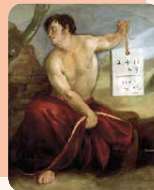
Dosso Dossi, Sapiente , 1520-21, Norfolk Virginia Chrysler Art Museum

Le immagini dei sapienti, filosofi e saggi a partire dall'arte antica, sono il filo conduttore della mostra intitolata "I volti della sapienza. Dosso e Battista Dossi nella Biblioteca di Bernardo Cles" visitabile fino al 22 ottobre 2023.